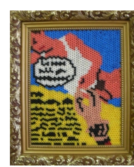
16 Deborah Sengl „Oriontarnung“