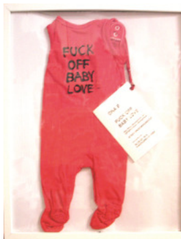
1 Ona B. „Fuck off Baby Love“

2011_ Strampelhöschen- Multiple Auflage 9 Stück