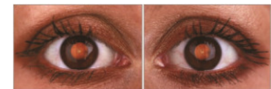
15 Werner Schuster „reflections I und II“

2008_C-Prints auf Aludibond kaschirt Glas- und Metallrahmen je 66 x 100 cm