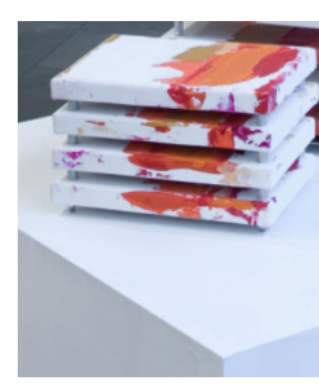
13 Tanja Prušnik „wandstele 5_dbö“

2008_Öl_Acryl_Dispersion auf Leinwand_Alu 18,5 x 13,5 x 10 cm