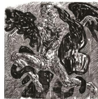
4 Karin Frank „Ganymed“

2011_s/w Holzschnitt 100 x 100 cm Auflage 8 Stück